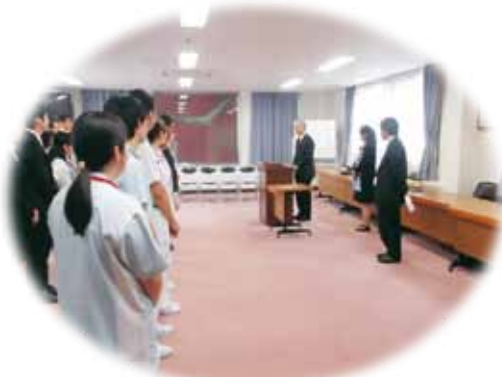
辞令交付式(会長挨拶)

平成28年度も、医師2名をはじめ、たくさんの仲間が増えました。よりパワーアップしてま いりますので、今後ともよろしく願いいたします。