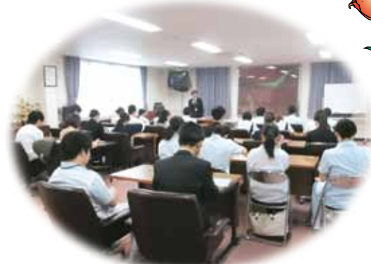
オリエンテーション風景